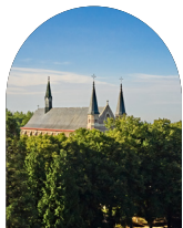
Abbaye du Mont des Cats