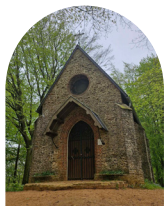
Chapelle de la Passion

Pars explorer le Mont des Cats et retrouve quelles photos correspondent à ces 3 bâtiments religieux : l'Abbaye, la Chapelle saint-Bernard ou la Chapelle de la Passion.