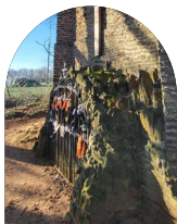
Chapelle de la Passion