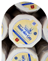
Abbaye du Mont des Cats